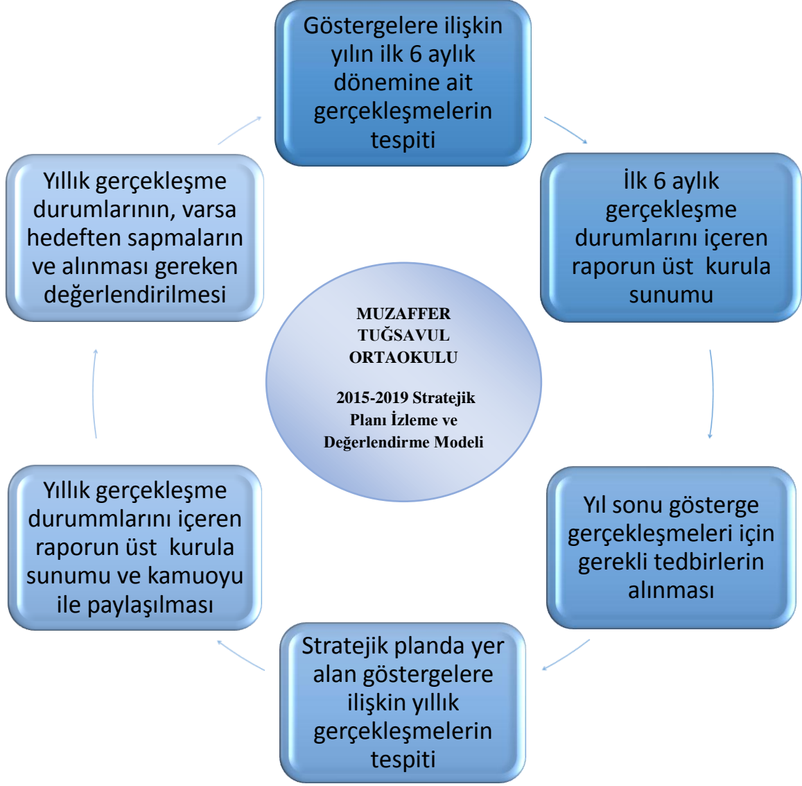
Şekil 1: Stratejik Planı İzleme ve Değerlendirme Modeli